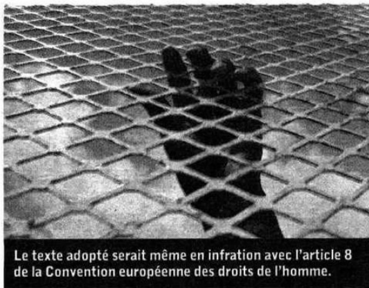
Le texte adopté serait même en infraction avec l'article 8 de la Convention européenne des droits de l'homme.

Aucune des propositions défendues par les organisations spécialistes de la défense et de la protection des étrangers n'a été retenue. Résultat : la commission des libertés a trouvé le 12 septembre un consensus qui va jusqu'aux élus socialistes et Verts pour proposer, en oubliant toute logique de protection, l'enfermement de tous ceux qui « font ou feront l'objet d'une mesure d'éloignement ». C'est-à-dire que même le demandeur d'asile pourra être enfermé en attendant que les autorités se prononcent sur son cas. C'est-à-dire que les personnes qui ne sont ni expulsables ni « régularisables » seront enfermées. Et cela pendant dix-huit mois, puisque c'est le laps de temps que le texte propose au maintien en rétention, des mineurs avec leur famille, des handicapés, des victimes de tortures, des femmes enceintes... Les mi-