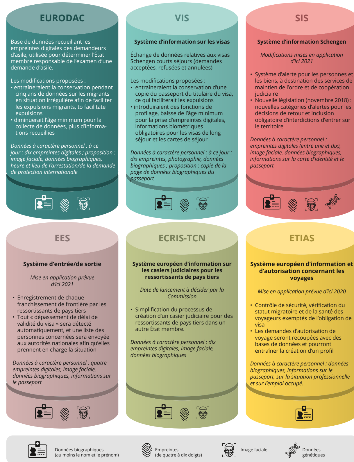
Figure 2: Bases de données européennes existantes et à venir, propres à la justice et aux affaires intérieures