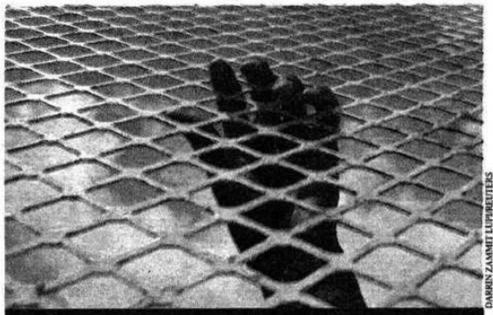
Le texte adopté serait même en infration avec l'article 8 de la Convention européenne des droits de l'homme.

Aucune des propositions défendues par les organisations spécialistes de la défense et de la protection des étrangers n'a été retenue. Résultat : la commission des libertés a trouvé le 12 septembre un consensus qui va jusqu'aux élus socialistes et Verts pour proposer, en oubliant toute logique de protection, l'enfermement de tous ceux qui « font ou feront l'objet d'une mesure d'éloignement ». C'est-à-dire que même le demandeur d'asile pourra être enfermé en attendant que les autorités se prononcent sur son cas. C'est-à-dire que les personnes qui ne sont ni expulsables ni « régularisables » seront enfermées. Et cela pendant dix-huit mois, puisque c'est le laps de temps que le texte propose au maintien en rétention, des mineurs avec leur famille, des handicapés, des victimes de tortures, des femmes enceintes... Les mi-